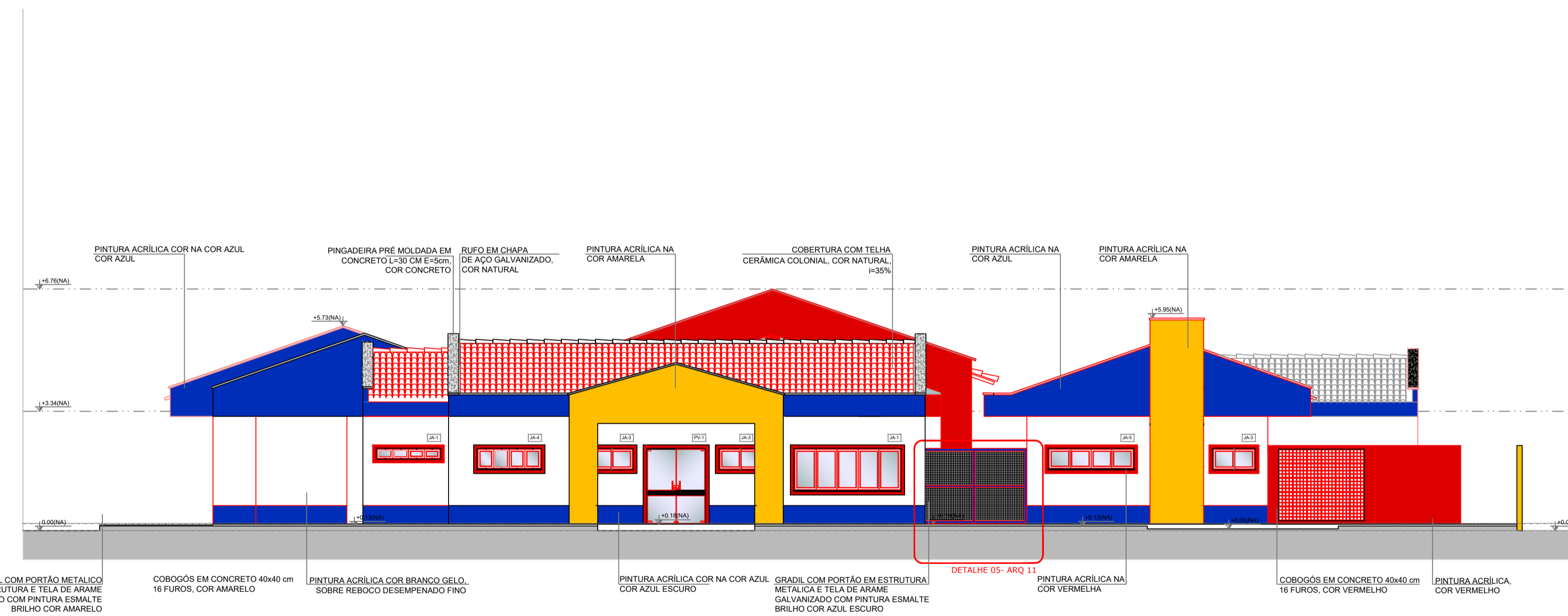
1 FACHADA 1 - PRINCIPAL ESCALA 1/100

NOTAS - DIMENSÕES EM METROS; - COTAS DE NÍVEL EM METROS; - VERIFICAR POSIÇÃO EXATA DOS PILARES NO PROJETO ESTRUTURAL; - VERIFICAR DETALHES CONSTRUTIVOS PERTINENTES NAS PRANCHAS DE DETALHAMENTO; - EM CASO DE CONFLITO DE INFORMAÇÕES ENTRE O PROJETO GRÁFICO E O CADERNO DE ESPECIFICAÇÕES, PREVALECE A INFORMAÇÃO CONTIDA NOS DESENHOS; - EM CASO DE CONFLITO DE INFORMAÇÕES ENTRE AS DIMENSÕES DESENHADAS E AS DIMENSÕES INDICADAS NAS COTAS E NÍVEIS, PREVALECE A INFORMAÇÃO CONTIDA NAS INDICAÇÕES DE COTAS E NÍVEIS; - ALTERAÇÕES NESTE PROJETO SOMENTE COM AUTORIZAÇÃO EXPRESSA DO FNDE REFERÊNCIAS: - MEMORIAL DESCRITIVO DO PROJETO; - ESPECIFICAÇÕES TÉCNICAS DO PROJETO DE ARQUITETURA; - PLANILHA DE QUANTITATIVOS; - CADERNO DE ENCARGOS